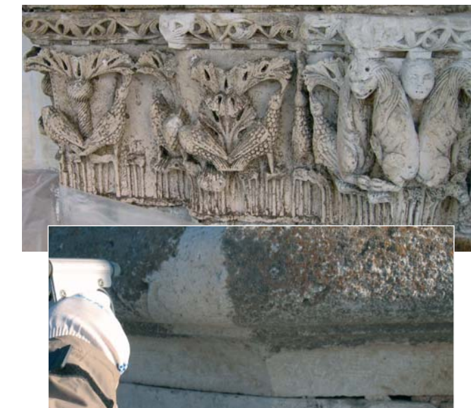
Limpieza de soportes lapídeos en piedra de Trani, ladrillos, arenisca.