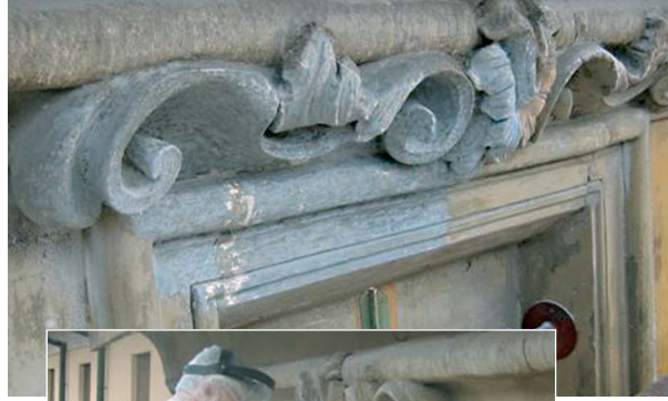
Limpeza de estuco y arenisca amarilla.

Lugo de Ravenna: Palacio Rossi (siglo XVII d.C.)