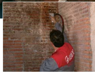
Limpieza piedras tobasas y ladrillos cerámicos, ladrillos tobasas, argamasca y travertino.