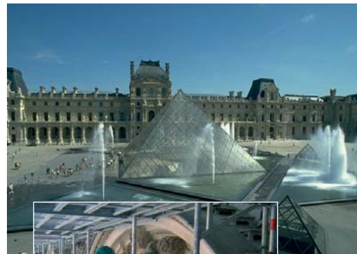
Limpieza de piedra arenisca.