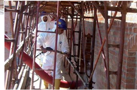
Limpeza de barro, fachadas de ladrillos y cerámicos.

Padua: Basílica de S. Antoni (siglo XIII d.C.)