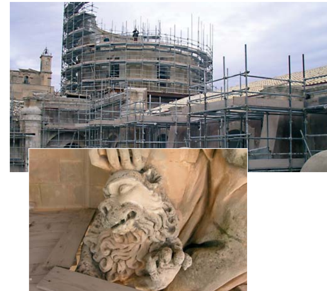
Limpieza de piedra calcárea muy blanda.