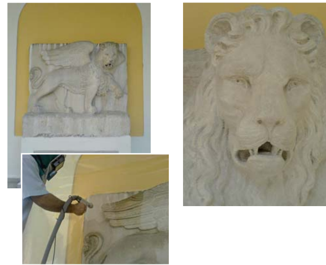
Limpieza de piedra con remoción de tres estratos de protector, realizada en seco con el mineral Garnet.