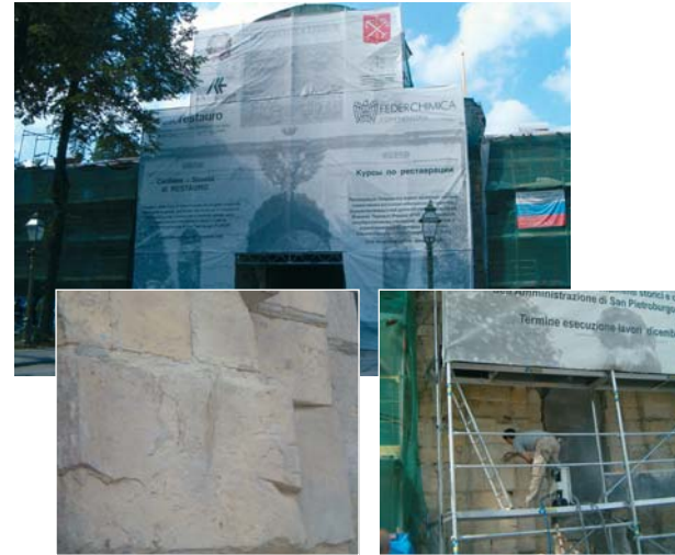
Limpieza de la piedra de Kikierno/dolomite, remoción de revoque y estuco. Limpieza/arenación de los sillares nuevos de reparación.