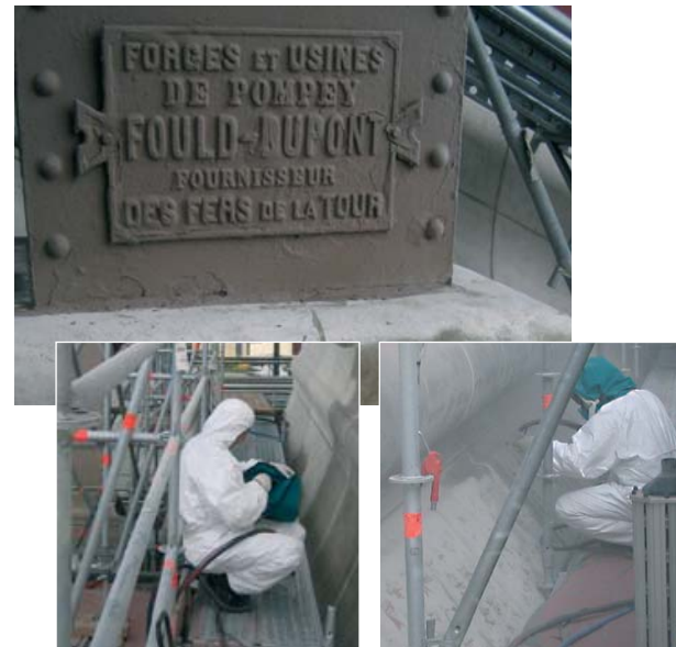
Limpieza de pilares de piedra.