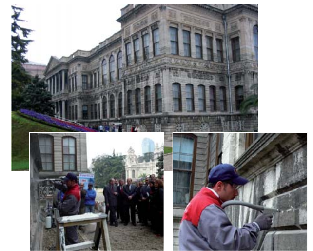
Limpieza de la piedra Kufeki, en seco y con agua micronizada y carbonato de calcio.