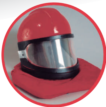
CASCO CON ALIMENTACIÓN DE AIRE