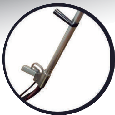
LANZA 1-2 METROS