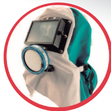
MÁSCARA DE PROTECCIÓN