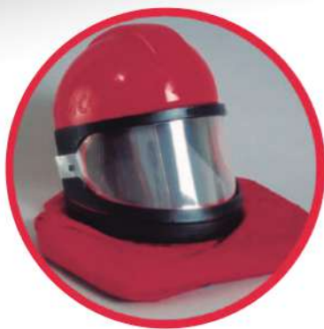
CASCO CON ALIMENTACIÓN DE AIRE