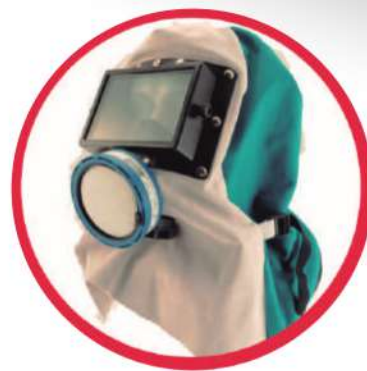
MÁSCARA DE PROTECCIÓN