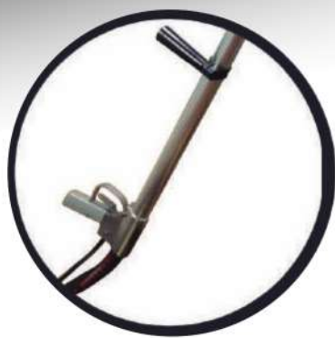
LANZA DE 70 CM